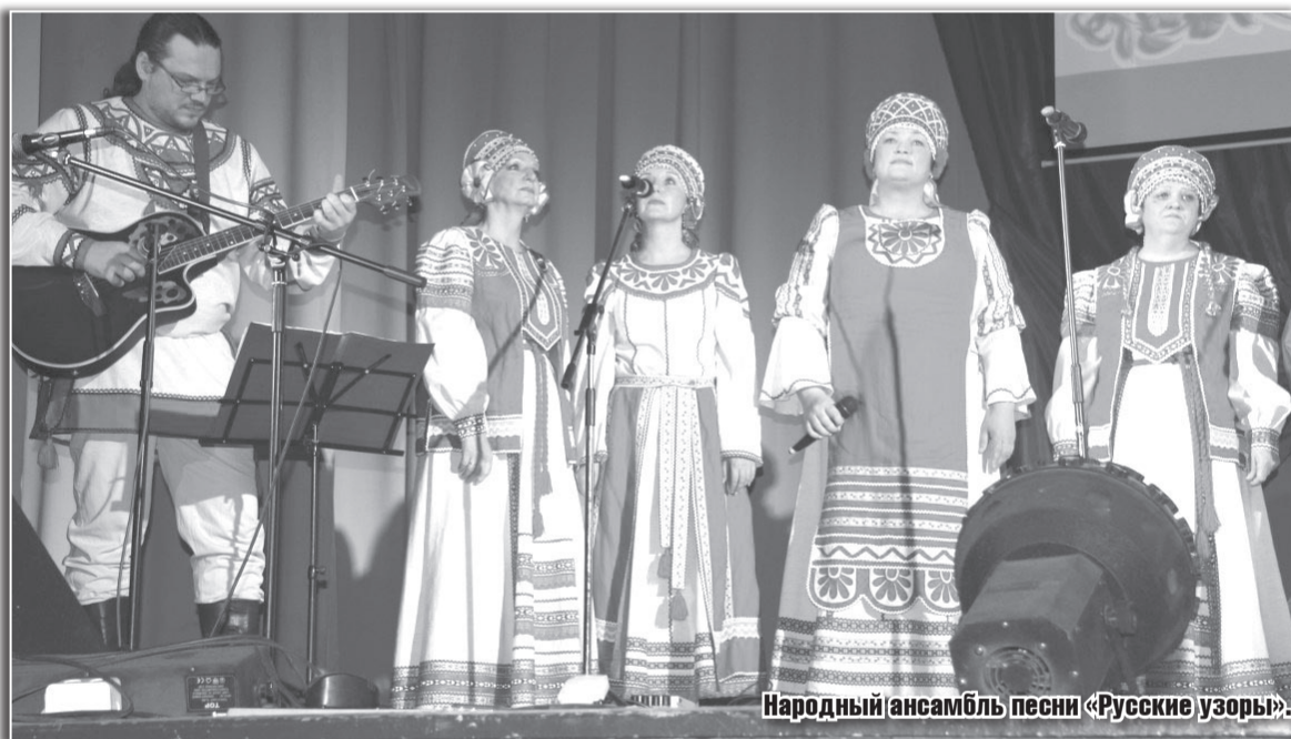
Народный ансамбль песни «Русские узоры».

- Концерт был очень увлекательным, интересным. Были приглашены гости из Сандова, Вёсьегонска – все они являются старыми друзьями ДНТ. Зал аплодировал стоя.