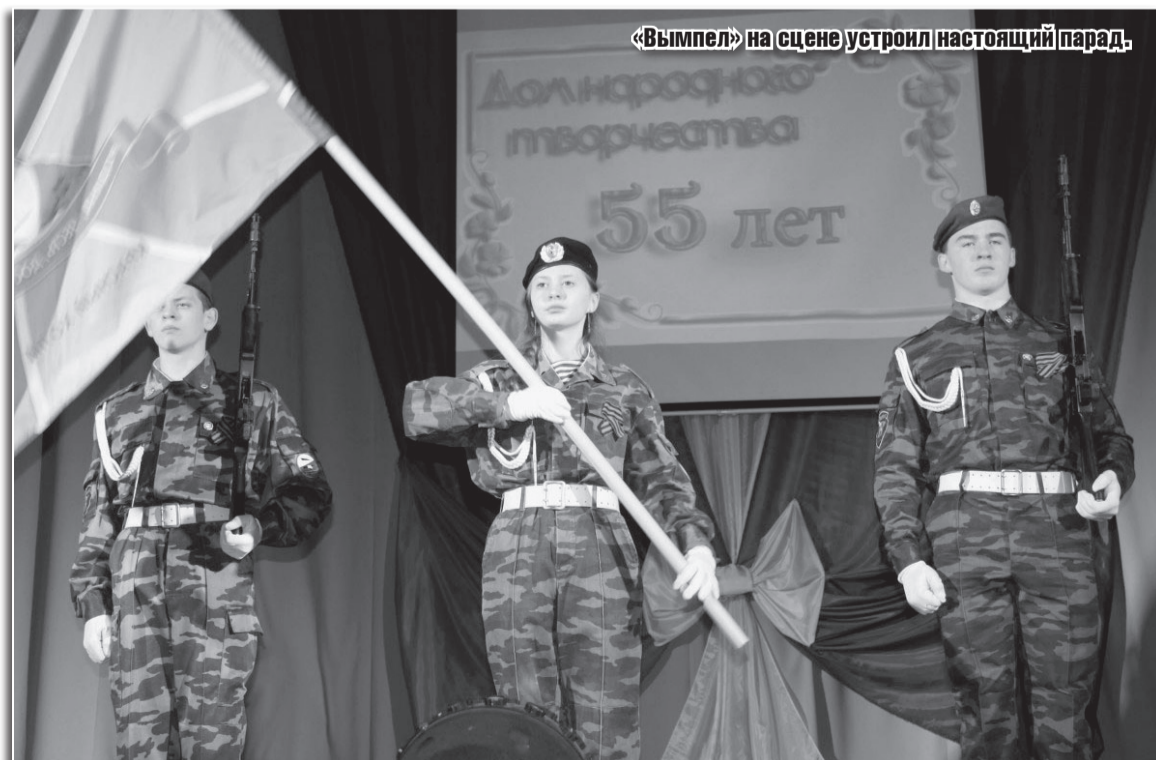
«Вымпел» на сцене устроил настоящий парад.

Р.С.: в юбилейном вечере также приняли участие члены объединения юных журналистов «Новое течение». Вот их отзывы.