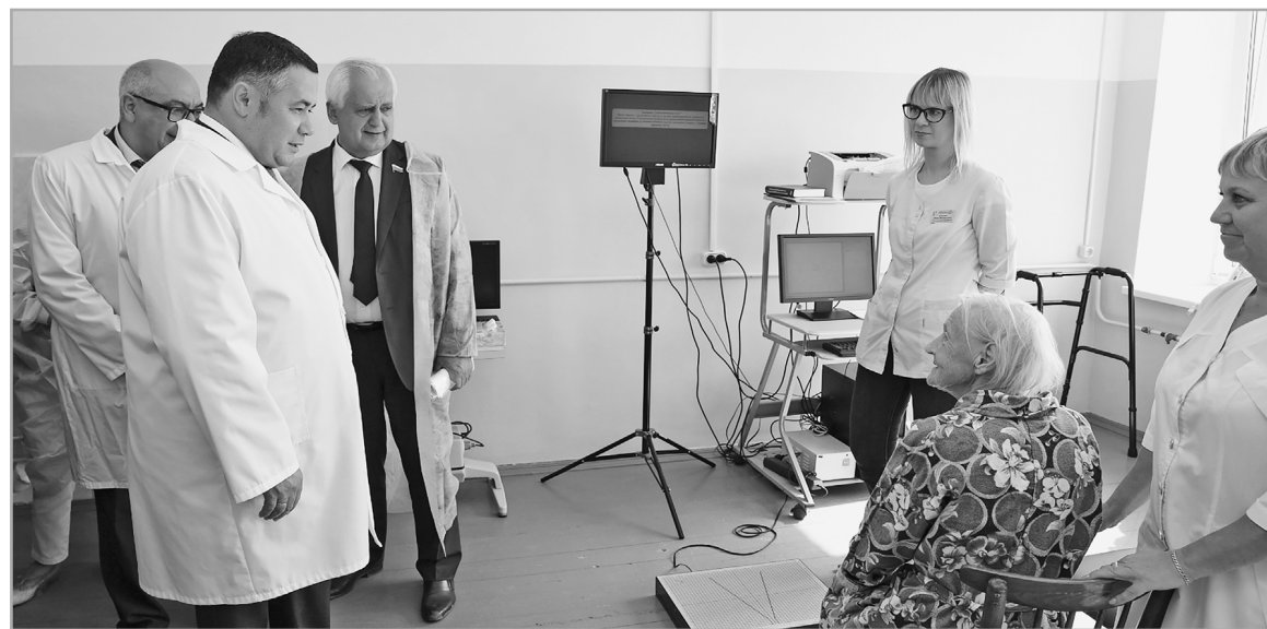
Доступ к качественной медицинской помощи в регионе намерены обеспечить всем жителям