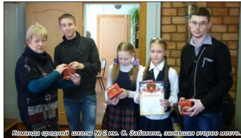
Команда средней школы № 2 им. С. Забавина, занявшая второе место.

педагог-организатор Дома детско-го творчества.