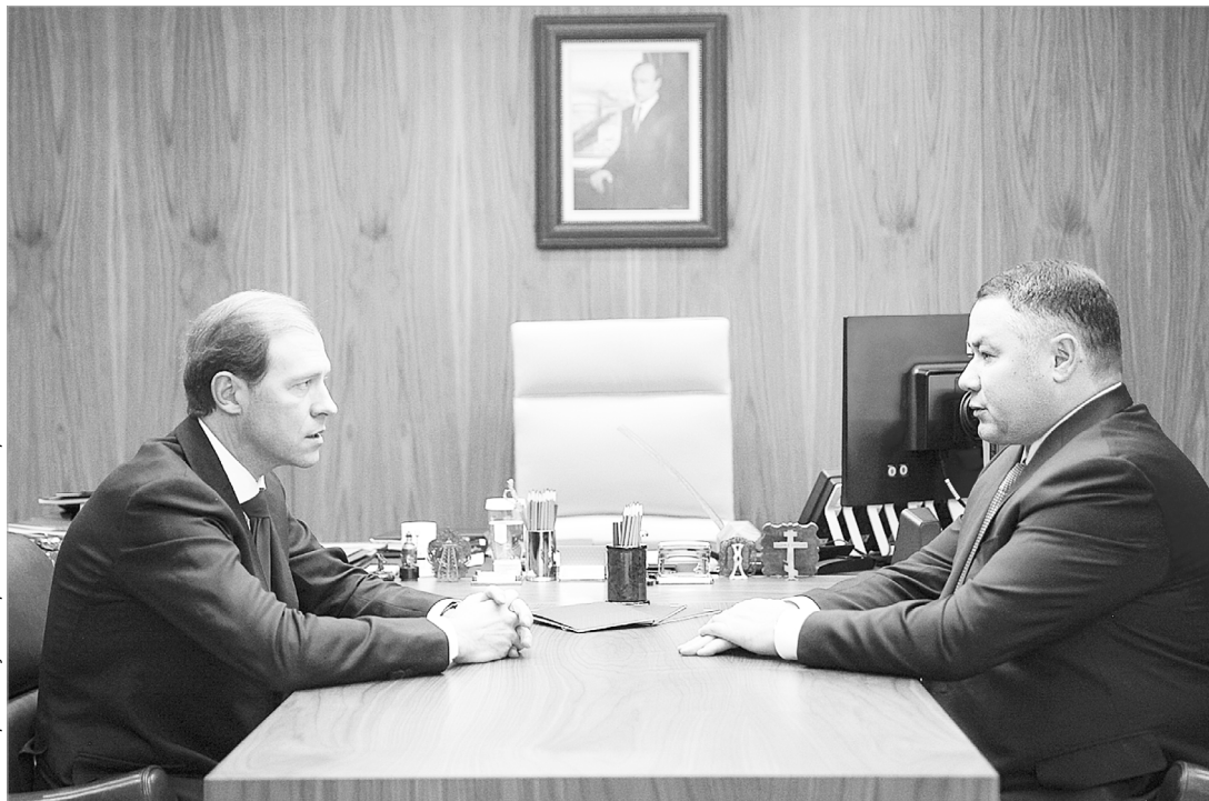
Министр промышленности и торговли России Денис Мантуров и губернатор Тверской области Игорь Руденя обсудили вопросы развития промышленности Верхневолжья

30 ноября в Минпромторге России состоялась встреча губернатора Тверской области Игоря Рудени и министра промышленности и торговли России Дениса Мантурова. Темой для обсуждения стали меры поддержки промышленности региона в текущей эпидемиологической ситуации.