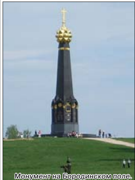
Монумент на Бородинском поле.

К стыду своему превеликому, прожив более полувека на этой грешной земле, ни разу не побывал на поле русской воинской славы у деревни Бородино. И лишь в 200-ю годовщину величайшего сражения, сподобился-таки отдать дань уважения славным нашим предкам.