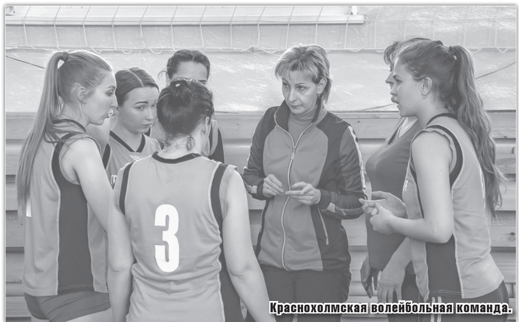
Краснохолмская волейбольная команда.

Настольный теннис. На втором этаже Детской спортивной школы среди девяти команд отличной результат показала наша команда по настоль-