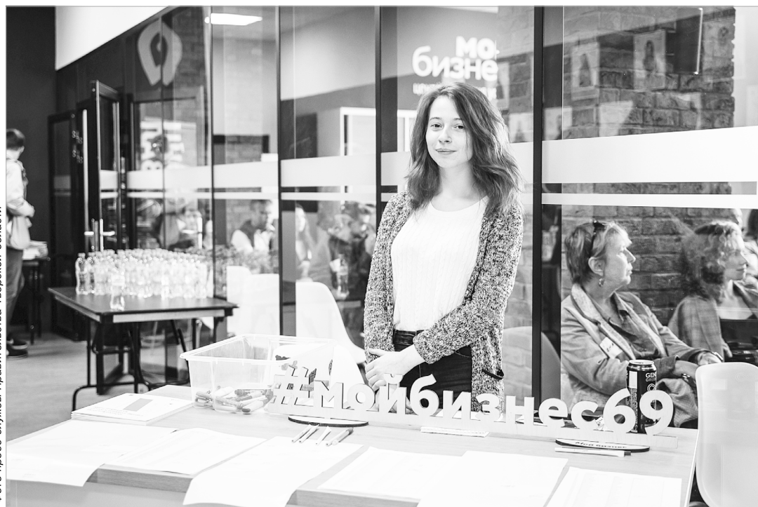
В центре поддержки предпринимательства «Мой бизнес» с 23 ноября стартует специальная образовательная программа для бизнес-леди

Подобная образовательная программа пройдет в Верхневолжье впервые и будет полностью бесплатной. В программе предусмотрены как офлайн-семинары, так и вебинары. 4 декабря, по окончании программы, состоится бизнес-девичник с вручением сертификатов, нетворкингом и фотосессией. Участие в образовательной программе бесплатно.