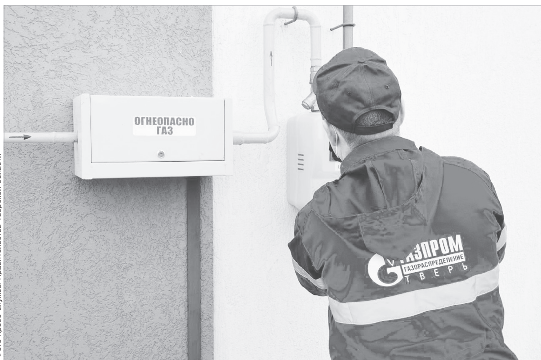
До 2025 года в Тверской области планируется ввести более 148 км газопроводов-отводов, 1100 км газовых сетей, обеспечить газификацию свыше 46 тыс. домовладений и подготовку к приему газа 117 котельных и промышленных предприятий

В рамках адресной инвестиционной программы (АИП) в 2022 году завершено строительство распределительных газопроводов в деревнях Федово и Терелесово Вышневолоцкого округа. Подведен газ в деревню Остров в Кимрском округе. Построены внутрипоселковые сети в Красном Холме, распределительный газопровод в Сонковском районе. Обеспечено газоснабжение в ряде населенных пунктов Рамешковского и Ржевского округов. Завершается ввод внутрипоселковых сетей в Максатихе. Идут работы в Кимрском, Нелидовском, Оленинском, Ржевском ок-