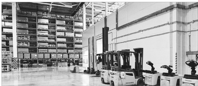
Инвестиции в логистический комплекс концерна «АвтоВАЗ» под Тверью получили региональную поддержку

На складе комплекса внедрены современные решения, в том числе возможности технологии голосового отбора. Она применяется для повыше-