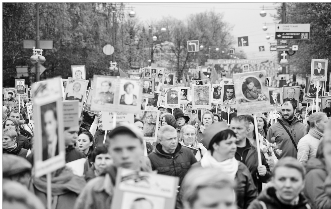
Жители нашей страны защищают историческую память

Россия новая, а Конституция старая: вот он, ответ на вопрос, почему главный документ страны действительно нужно