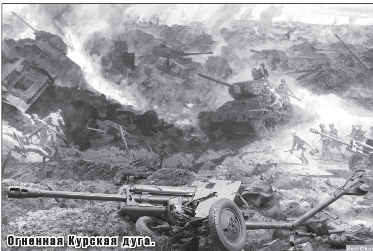
Огненная Курская дуга.