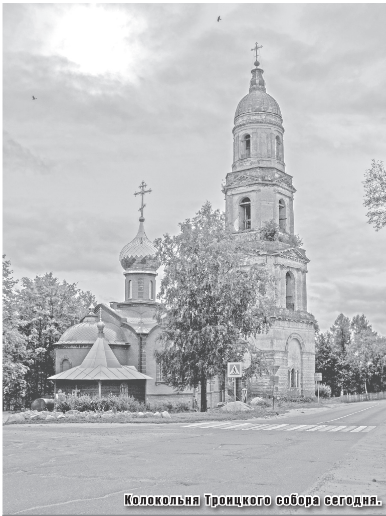
Колокольня Троицкого собора сегодня.