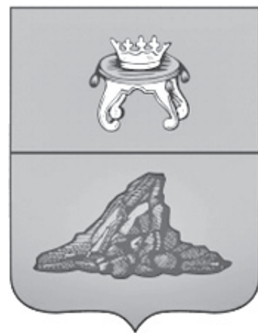
Исторический герб Красного Холма (1781 г.)